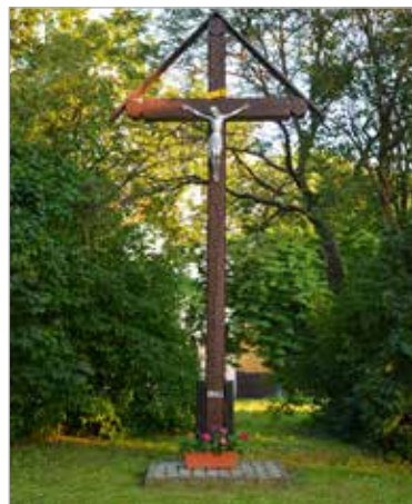
Drewniany krzyż z 1945 r.