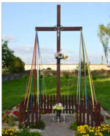
Drewniany krzyż przy drodze