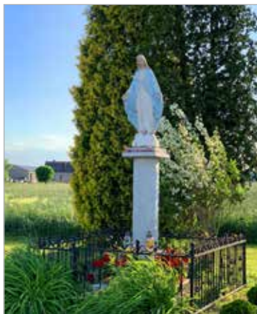
W Skałowie znajduje się jedyna kapliczka Matki Boskiej, przy dojeździe do posesji nr 1, od strony ul. Półwiejskiej. Figura usytuowana jest na pograniczu terenu prywatnego i pobocza drogi gminnej. Przed II wojną światową w tym miejscu prawdopodobnie stała podobna kapliczka, zniszczona przez Niemców, a następnie odbudowana.