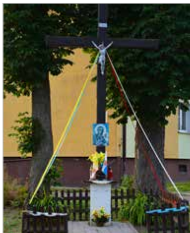
Drewniany krzyż z obrazem Matki Boskiej zlokalizowany przy blokach w centrum wsi.