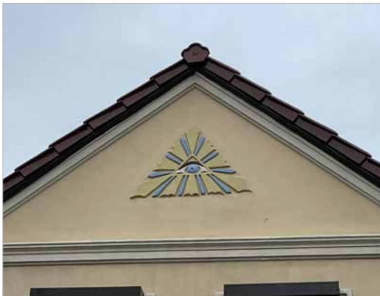
Oko Opatrzności na kamienicy przy ul. Kościuszki w Kostrzynie

Kiedy w 1920 r. osiedliły się w Kostrzynie w ufundowanym przez hrabiostwo Mielżyńskich budynku przy ul. Poznańskiej 19 Siostry Służebniczki NMP, na frontonie domu ustawiono figurę św. Józefa, stojącą tam do dziś. Krzyże widnieją też na budynkach kościoła farnego, probostwa, Domu Katolickiego, a także do niedawna starego domu przy ul. Średzkiej 18. Dawniej zdobiły one również budynek kościoła ewangelickiego i pastorówki przy ul. Kościuszki nr 11. Na kilku kamienicach w centrum Kostrzyna można podziwiać zachowane na frontowych ścianach wpisane w trójkąt Oko Opatrzności z wiązkami promieni, będące znakiem boskiej opieki.