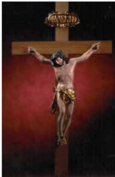
Zabytkowy drewniany krzyż na dawnym Domu Starców