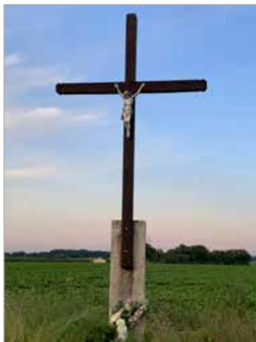
Drewniany krzyż na betonowej podstawie na początku ulicy Strumiany