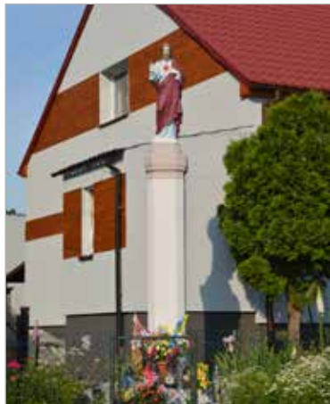
Figura Serca Pana Jezusa w centrum miejscowości Buszkówiec została odrestaurowana ze środków Budżetu Obywatelskiego w 2016 roku.