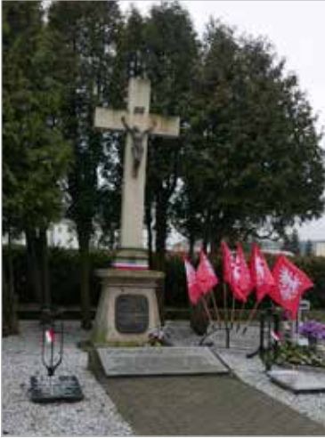
Krzyż na cmentarzu w Kwaterze Powstańców Wielkopolskich i Pomordowanych w czasie II wojny światowej

Krzyżanowskiego w Poznaniu, zbudowano ogrodzenie z łańcuchów zawieszonych na granitowych słupach. W pierwszych miesiącach okupacji hitlerowskiej Niemcy przetransportowali ten krzyż na cmentarz parafialny. Po wojnie w 1945 r. przesunięty został do kwatery pomordowanych w 1939 r. mieszkańców Kostrzyna i okolic, tuż obok grobów powstańców wielkopolskich. Dziś po ponad 100 latach stanowi świadectwo wiary naszych ojców i braci. Przy nim odbywają się do- roczne uroczystości patriotyczne i religijne. Na rogatkach miasta, w pobliżu skrzyżowania dawnej szosy, dziś ulicy Poznańskiej z ulicą