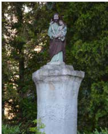
Figura św. Józefa z Dzieciątkiem przy ul. Wiejskiej.