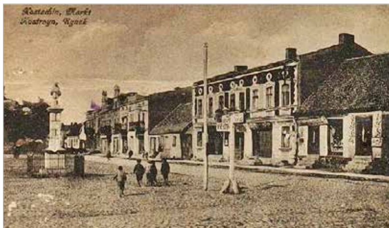
Figura Jana Nepomucena na kostrzyńskim Rynku, istniejąca do 1939 r.

obecnymi ulicami Poznańską i Kościuszki postawiono, w miejscu gdzie stał kiedyś drewniany kościółek szpitalny św. Ducha, pięciometrowy krzyż z kamienia piaskowego. Ufundowany z dobrowolnych ofiar parafian zawiera napis: „1901 – Chwała na wysokości Bogu, Na ziemi pokój ludziom dobrej woli. Wierni parafianie – dumą kościoła”. Wokół krzyża, wykonanego przez firmę