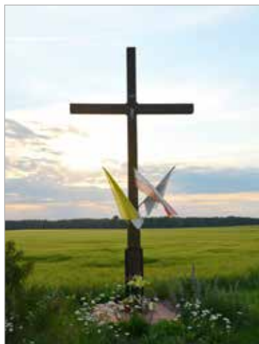
Krzyż znajduje się przy drodze Rujśca – Sanniki.