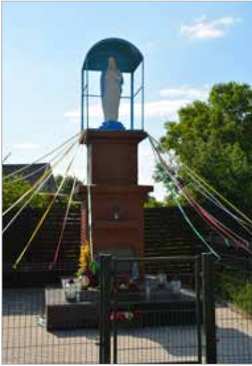
kapliczka NMP Niepokalanej odrestaurowana w 2019 r.