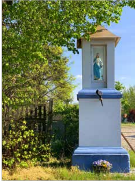
Kapliczka znajduje się za kościołem pw. Św. Jadwigi, przy ul. Parkowej