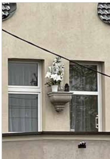
Figura św. Józefa na frontonie domu przy ul. Poznańskiej 19

Symbole religijne znajdują się też na wielu budynkach Kostrzyna. Zabytkowy drewniany krzyż barokowy z XVII w. wisiał przez wiele lat na Domu Starców Kościoła Katolickiego przy ul. Kościelnej. Po przeprowadzonej w 2005 r. konserwacji ta piękna polichromowana rzeźba Chrystusa Ukrzyżowanego na stałe została zawieszona w salce Domu Katolickiego przy ul. Dworcowej. Jej miejsce zajął współczesny wizerunek Chrystusa Ukrzyżowanego.