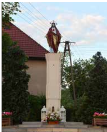
Figura Najświętszego Serca Jezusowego