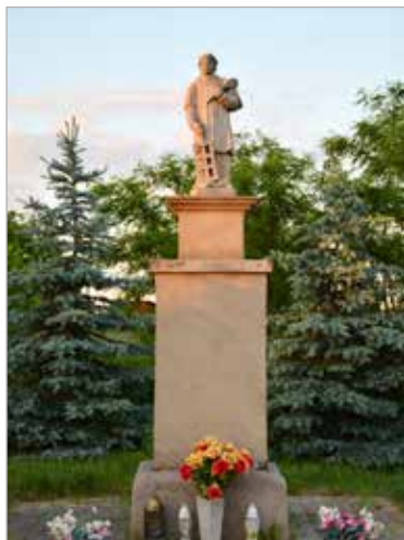
Figura św. Wawrzyńca we wsi Sokolniki Drzążgowskie i odnowiona w 2012 r.