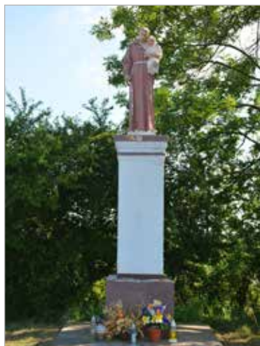
Figura św. Antoniego na skrzyżowaniu dróg Siedlec – Antonin