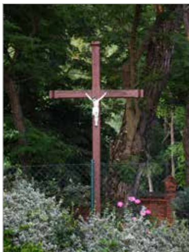
Drewniany krzyż na prywatnej posesji