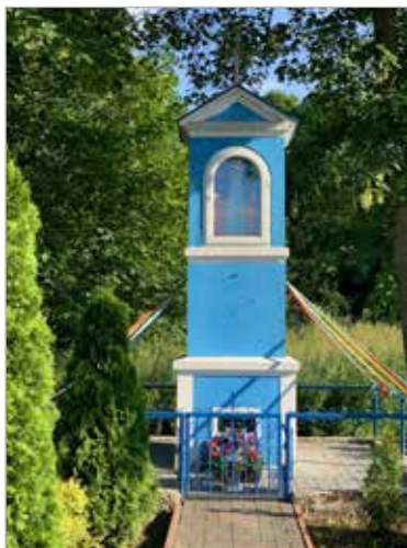
Kapliczka Matki Boskiej w centrum Gwiazdowa została zbudowana w 1935 r. przez miejscową młodzież należącą do Związku Strzeleckiego. Na cokole napis „O Maryjo bez grzechu poczęta, módl się za nami”.