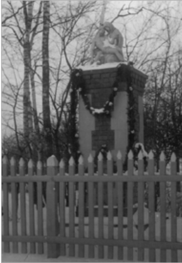
Pieta w Ignacewie