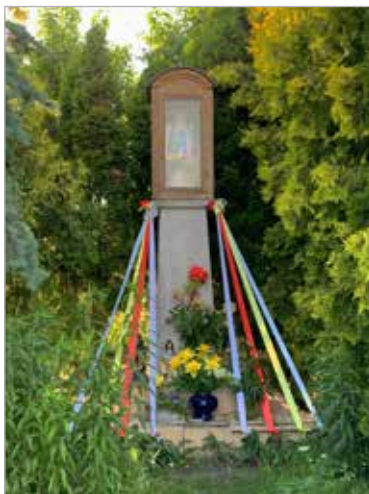
Figura postawiona na prywatnej posesji jej właściciela Stanisława Zduńczyka.