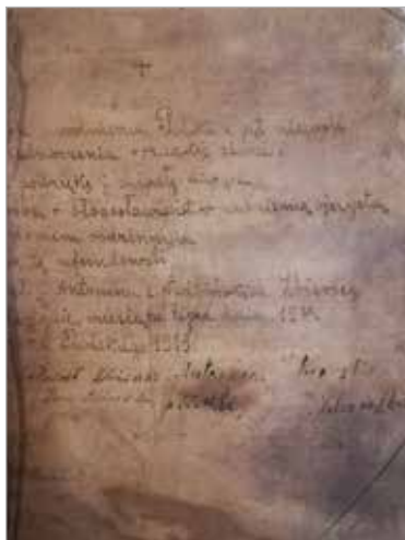
Akt fundacyjny Figura Najświętszego Serca Pana Jezusa