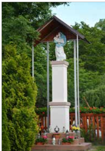
Figura Matki Boskiej z Dzieciątkiem przy drodze do Gniezna