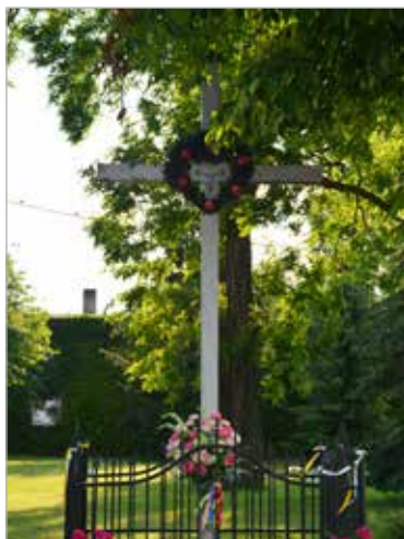
Krzyż na rozdrożu w centrum wsi