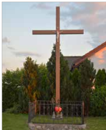
Krzyż przydrożny między miejscowościami Klony i Czerlejno. Odbywają się tu uroczystości święcenia potraw wielkanocnych.