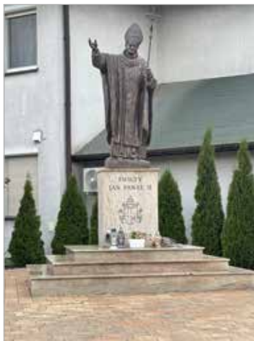
Figura św. Jana Pawła II przy nowej kaplicy od strony ul. Prymasa Wyszyńskiego.

St. i M. Kausowie. W czerwcu 2001 r. powstała w Kostrzynie nowa parafia pw. bł. Jolanty. W tymże roku stanął piękny krzyż na podwyższeniu obok kaplicy przy ulicy Andrzejewo. W obrębie parafii znalazła się też figura Matki Bożej na murowanym słupie, stojąca od 1925 r. na skrzyżowaniu Andrzejewo z szosą kórnicką. Nieopodal, przy ulicy Ignacewo, w 1986 r. postawiono przeniesioną z kościoła parafialnego w Kostrzynie figurę Serca Jezusowego. Przy nowej kaplicy od strony ul. Prymasa Wyszyńskiego stanęła figura św. Jana Pawła II.