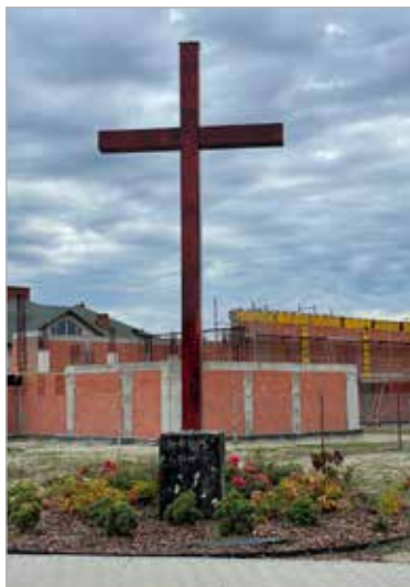
Krzyż obok dawnego budynku parafii bł. Jolanty przy ul. Andrzejewo