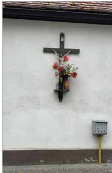
Współczesny wizerunek Chrystusa Ukrzyżowanego przy ul. Kościelnej