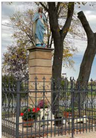
Figura Matki Bożej (ul. Kórnicka) z 1925 r.

St. i M. Kausowie. W czerwcu 2001 r. powstała w Kostrzynie nowa parafia pw. bł. Jolanty. W tymże roku stanął piękny krzyż na podwyższeniu obok kaplicy przy ulicy Andrzejewo. W obrębie parafii znalazła się też figura Matki Bożej na murowanym słupie, stojąca od 1925 r. na skrzyżowaniu Andrzejewo z szosą kórnicką. Nieopodal, przy ulicy Ignacewo, w 1986 r. postawiono przeniesioną z kościoła parafialnego w Kostrzynie figurę Serca Jezusowego. Przy nowej kaplicy od strony ul. Prymasa Wyszyńskiego stanęła figura św. Jana Pawła II.