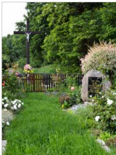
Krzyż znajduje się w centrum wsi, po drugiej stronie ulicy jest sklep. Obok krzyża stoi obelisk ufundowany przez Gminę Kostrzyn z okazji 100-lecia Powstania Wielkopolskiego.