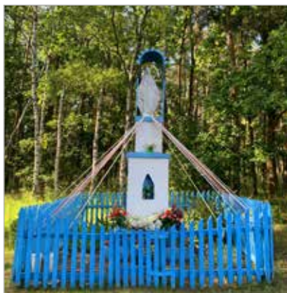
Powstała w latach 1985-87 figura Matki Boskiej znajduje się przy lesie, na skrzyżowaniu dróg Brzeźno – Siedleczek – Leśna Grobla. W roku postawienia figury (ok. 1987) proboszczem w Siedlcu był ks. Cegła.