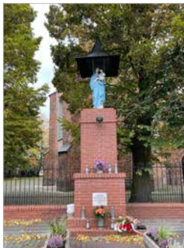
Figura NMP Niepokalanego Poczęcia z Dzieciątkiem przy ul. Średzkiej

obecnymi ulicami Poznańską i Kościuszki postawiono, w miejscu gdzie stał kiedyś drewniany kościółek szpitalny św. Ducha, pięciometrowy krzyż z kamienia piaskowego. Ufundowany z dobrowolnych ofiar parafian zawiera napis: „1901 – Chwała na wysokości Bogu, Na ziemi pokój ludziom dobrej woli. Wierni parafianie – dumą kościoła”. Wokół krzyża, wykonanego przez firmę