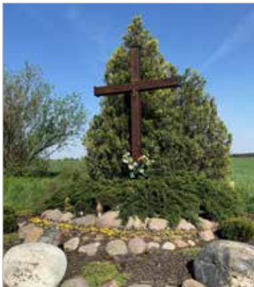
Krzyż usytuowany przy skrzyżowaniu ulic Kostrzyńskiej i Kórnickiej (wjazd na Okopy).