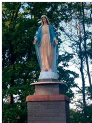
Figura Matki Bożej Niepokalanej, poświęcona w 2021 r.