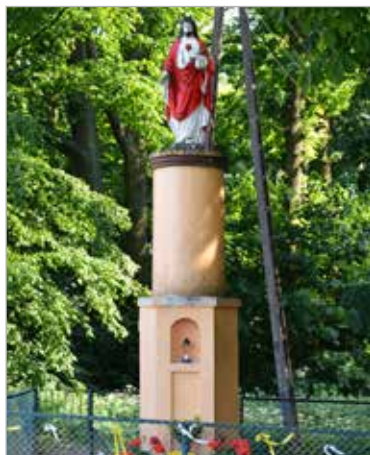
Figura Najświętszego Serca Pana Jezusa zlokalizowana przy parku w centrum wsi.