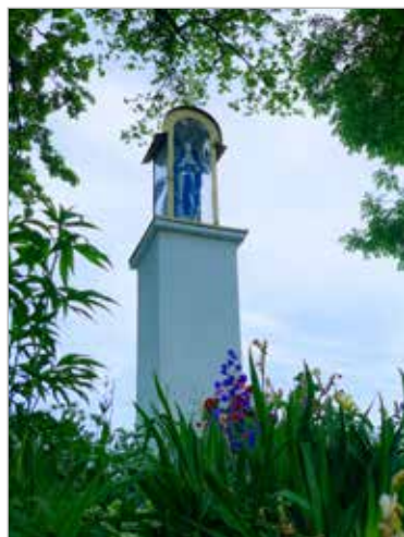
Figura Matki Bożej znajduje się na skarpie przy drodze Iwno – Wiktorowo.