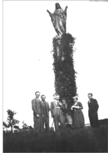
Figura Chrystusa przy drodze do Iwna, zburzona w 1939 r.