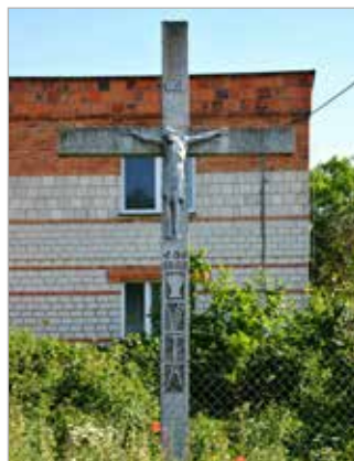
Około 100-letni krzyż znajduje się przy drodze do Siedlca, na prywatnej posesji. Postawiony został prawdopodobnie przez przodków właściciela nieruchomości.